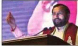
Prakash Javadekar at the convocation.

Speaking as chief guest at the convocation ceremony of Forest Research Institute in Dehradun,